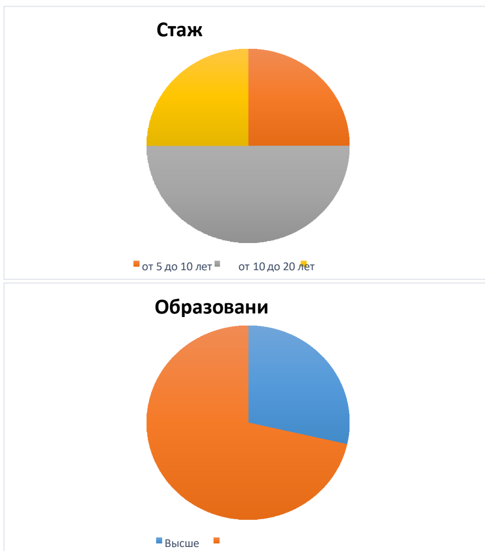
Диаграмма с характеристиками кадрового состава ДОО:

ДОО укомплектовано педагогами на 100 процентов согласно штатному расписанию. Всего работают 29 человек. Количество педагогов – 9 человек. Из них, 8 воспитателей, 1 музыкальный руководитель.